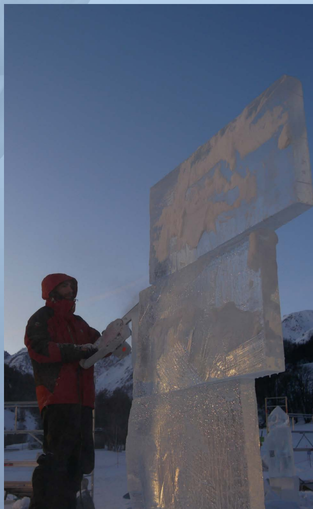
"I believe I can Fly" - DUSAVITSKIY - 2023

Comment cette sculpture peut tenir ? Combien de temps la sculpture va rester ? ... mais l'artiste tient bon jusqu'à la fin du Concours et son œuvre éphémère donne l'illusion d'éternité.