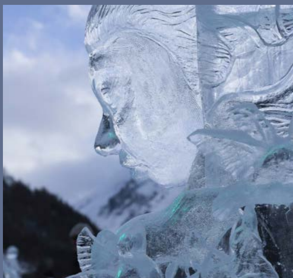
"Give your thoughts wings" - RODERS - 2023

Allemagne – Belgique – Danemark – Espagne – Italie – Lituanie – Mexique – Mongolie – Pays Bas – République Tchèque – Royaume Uni – Taïwan – Turquie – Ukraine – France