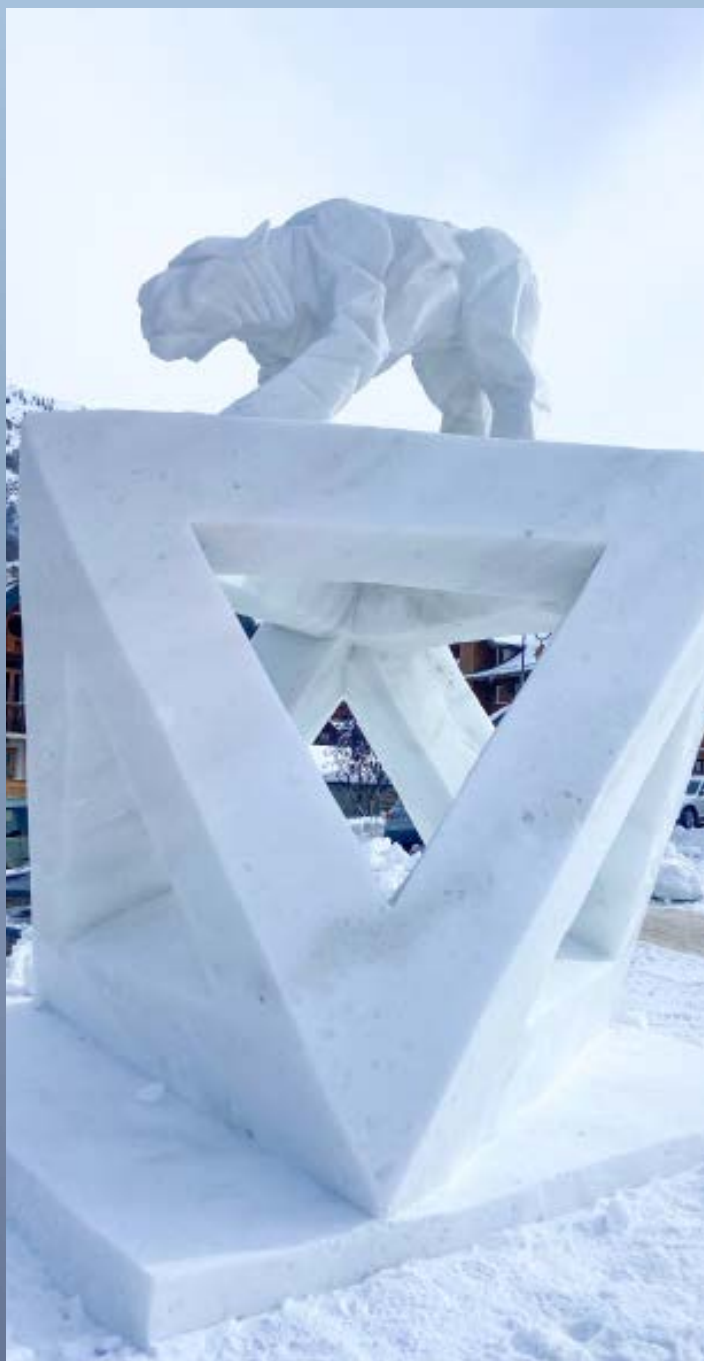
"Le lynx Platon" - GRAMMONT BERLIOZ DUMASIMG - 2023

À l'heure où nous écrivons ces lignes, les futurs sculpteurs participants sont en cours de sélection. La décision finale interviendra le 19 octobre lors de la Commission de Sélection.