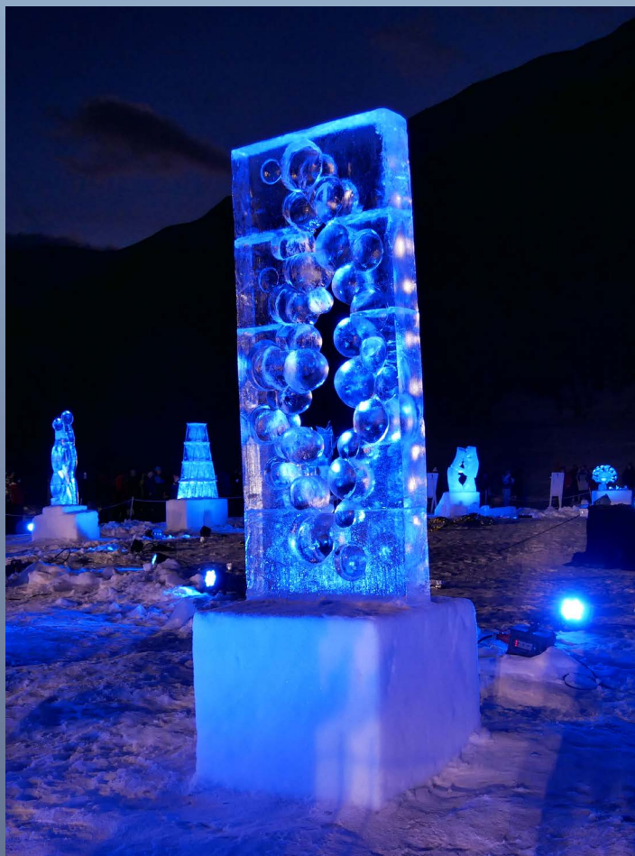
"Bubble flow" - JORDA - 2023

Certains d'entre eux vont plus loin, en créant et fabriquant leurs propres outils adaptés à la sculpture. Ainsi en est-il d'appareils à vapeur pour lisser la glace.