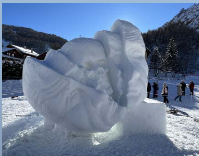
"Poupées Russes" - LIEVORE DIANO LIEVORE - 2023