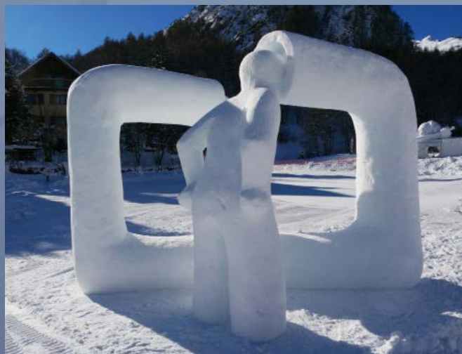
"Conversation" - DANAS ANICAS URBANSKAS - 2023

Seuls 9 pays dans le monde organisent cette année une telle manifestation : le Canada, la Chine, la Russie, le Japon, les USA, la Suisse, l'Italie, la Finlande et la France est donc représentée par Valloire.